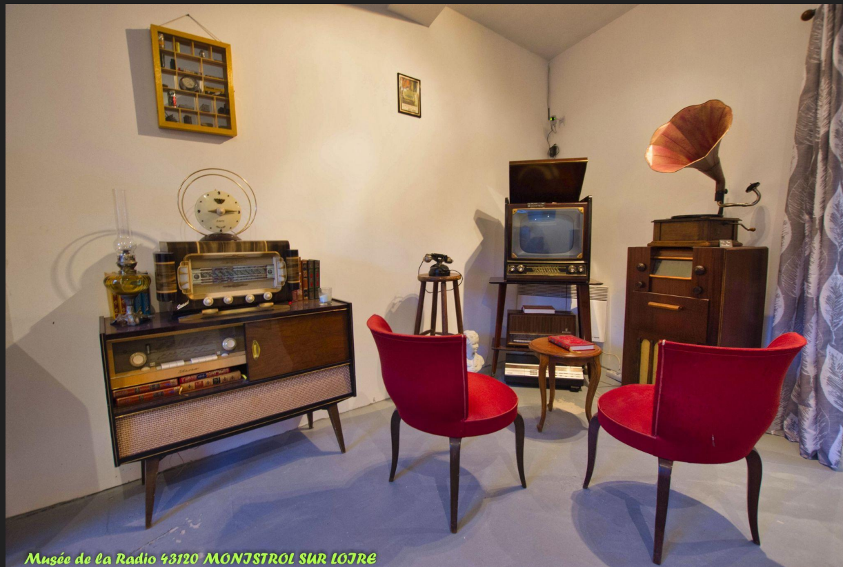
Musée de la Radio 43120 MONESTROL SUR LOIRE

Le musée de la radio propose plusieurs collections issues de la région Auvergne Rhône Alpes.